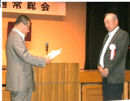
商工貯蓄共済大口加入者 表彰

(株)フクテコ様 (有)光浪運送様 出岡重量運輸(株)様 互栄商事(有)様 (有)石鹿商店様